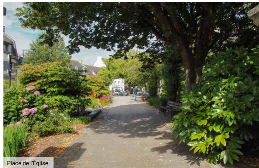
Place de l'Église